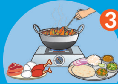
వంట చేయడానికి ముందు మరియు తర్వాత, భోజనానికి ముందు