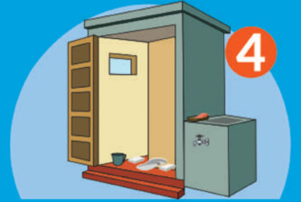
మరుగుదొడ్డిని వాడిన తర్వాత