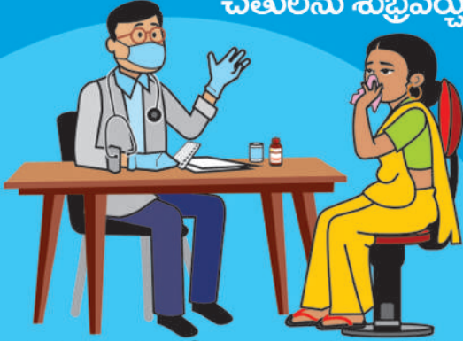
మీకు దగ్గు, జ్వరం లేదా శ్వాస తీసుకోవడంలో ఇబ్బంది ఉంటే, వెంటనే డాక్టరును సంప్రదించండి.