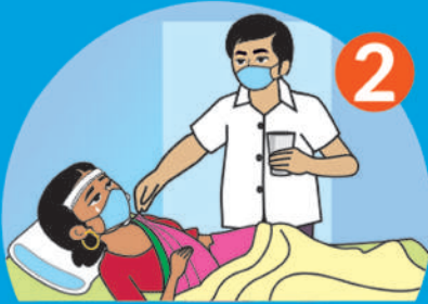
అనారోగ్యంగా ఉన్న వ్యక్తికి సపర్యలు చేయడానికి ముందు మరియు తర్వాత చేతులను శుభ్రపర్చుకోవాలి.